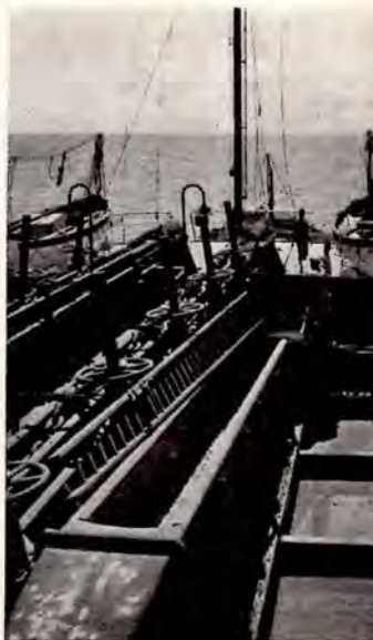
Onze hopperzuiger „Pungué” aan het werk