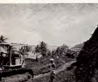
Foto 1 Strandgezicht in Lourenço Marques