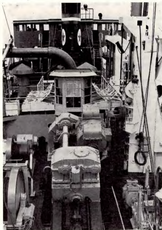
Een kijkje op de „Maria Teresa”

Zonder avonturen bereikten we de rede van Den Helder, waar onze lijfloods aan boord kwam en ons met bekwame spoed naar een plaats met „lekker zand” voerde. De buis ging overboord, de BB schroef werd af- en de zandpomp aangekoppeld, waarna bleek, dat het zand werkelijk lekker was, want de hopper werd snel gevuld. We waren allemaal zo tevreden, dat we het nog eens wilden proberen. De la-