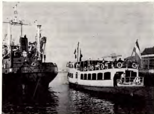
Het gezelschap vertrekt met de „Regentesseplaat”. Links ziet U de CO. 385

„SHAHM” weldra dit bouwstadium bereikt zal hebben en zij spoedig hun taak in het Suezkanaal zullen kunnen aanvaarden. Hij bracht ten slotte een dronk uit op het welzijn van de V.A.R. en van Nederland en in het bijzonder op